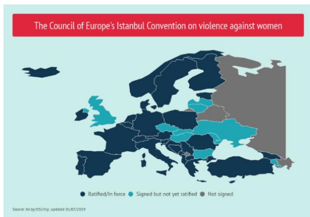
Obrázek 1 Přehled podpisů a ratifikací Istanbulské úmluvy k 1. červenci 2019. (Istanbul Convention, 2020)

Na Istanbulskou úmluvu se rozcházejí názory nejen laické, ale i odborné veřejnosti, a to jak v Česku 6 , tak i v dalších zemích Rady Evropy – např. Slovensko 7 , Maďarsko 8 a Bulharsko 9 už avizovaly, že k ratifikaci nepřistoupí. Specifickou kapitolou je pak Polsko, kde tamní ministerstvo spravedlnosti už iniciovalo odstoupení od Úmluvy 10 , což se setkalo s ostrou kritikou i ze strany Rady Evropy 11 , ačkoliv je s touto možností počítáno v článku 80 IÚ (Council of Europe, 2011). V tomto kontextu je vhodné zmínit také fakt, že od Úmluvy pravděpodobně odstoupí také Turecko. V zemi to vyvolalo protesty žen 12 , kampaň proti tomuto rozhodnutí dále spustila i třeba nezisková organizace Amnesty international 13 .